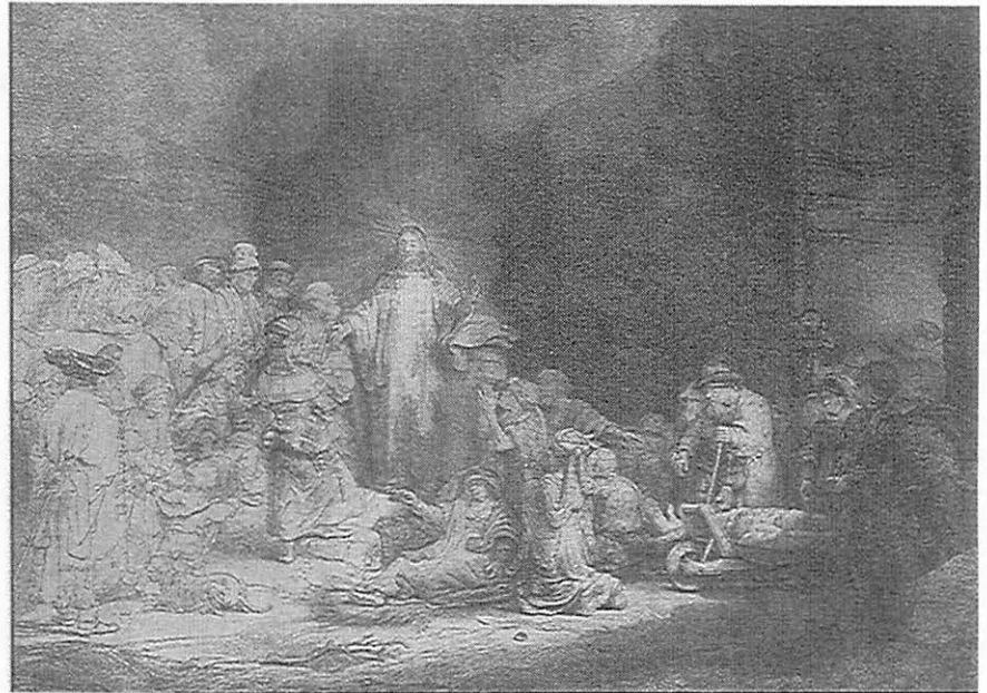
Cristo sanando a los enfermos (1642).

¿Qué sobrevivió a Rembrandt? A nivel personal, una hija de su segundo matrimonio, quien había tenido un hijo que murió antes que su abuelo. En el arte, una destacada herencia de más de 600 pinturas, 1.400 dibujos y por lo menos 30 aguafuertes (láminas grabadas). Pero posiblemente es en la filosofía que había detrás de su arte que Rembrandt dejó su más profundo legado. Demostró que la vida puede tener sus abismos de desesperación y sus cumbres de esperanza y dicha y aun así, como artista, pudo ser el prototipo de un profundo valor